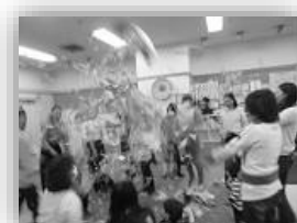
いくたす 「新聞ポーン(1歳さんあつまれ)」