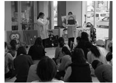
だるまさんが・・・「どてっ」

ところ 伊予-カド-福山店 エントランスホール 日にち 2018年 3月 8日(木)