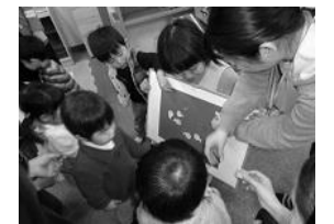
いくたす 2歳さんあつまれ「金魚が逃げた!」

<いくたす> —イトーヨーカドー 2階— ●開館時間10:00~16:00 ●★印は予約制の講座です 予約は1週間前から電話で受け付けます(受付時間:9:30~16:00) ●「ほいくの園」おでかけ保育の日は1階イトーカドーで活動します