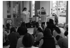
絵本「だるまさんが」