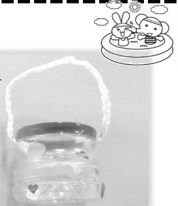
(記事担当) 大門未来園