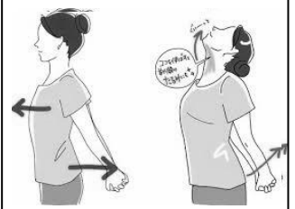
手を後ろに組み胸を張り 首の前をしっかり伸ばします