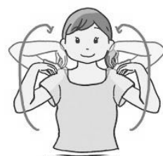
手を肩においてクルクル 肩甲骨が動くのを意識して

子育てはつらいものではなく「いくじ たのしい すばらしい」ものでありますように・・・